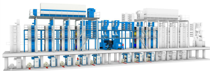
La Commander de Jordan Press con seis torres, dos plegadoras y un horno de secado.

ABD, el sistema de control de Fan-out en bucle cerrado de Q.I. Press Controls va a ser una parte importante del alto rendimiento del registro de impresión en Amman. Al ser el papel un sustrato de fibra natural, el mojado ensanchará la banda de doble ancho durante el proceso de impresión. Pero el ABD ajustará automáticamente en las seis unidades de impresión esas desviaciones del fan-out gracias a la información recibida de las 48 cámaras mRC+ instaladas en la Commander.