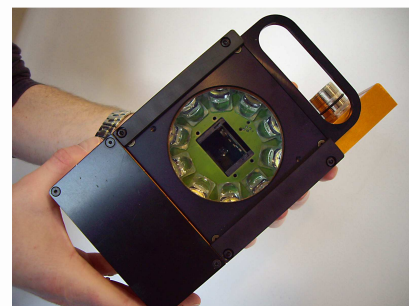
West Ferry Printers' CT-Commander printquality will rely on Q.I. Press Controls' widely proven m RC+ cameras.

We are everywhere! Met 8 kantoren wereldwijd en een mondiaal agentennetwerk, garandeert Q.I. Press Controls snelle persoonlijk service en ondersteuning. Voor meer informatie: www.qipc.com