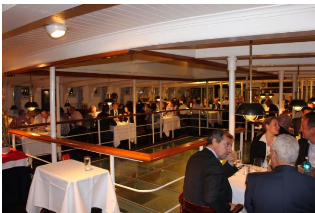
Sfeerimpressie Rickmer Rickmers evenement